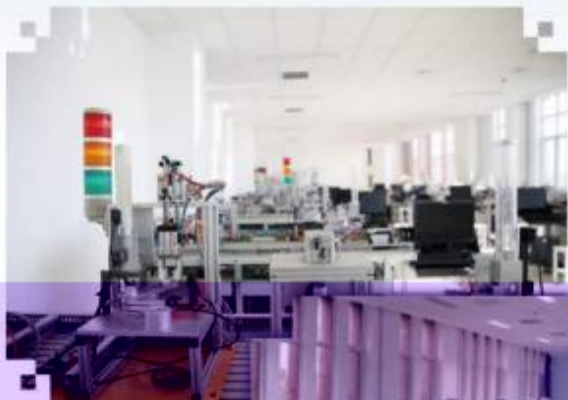
自动化生产线安装与 调试训练场所