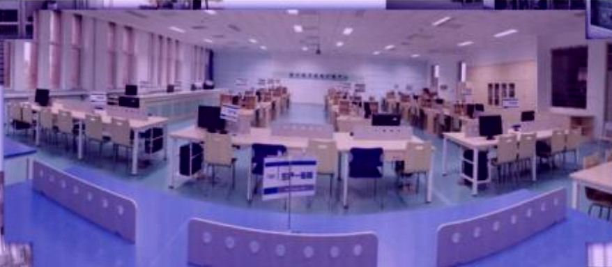
商贸管理类专业 综合训练场所