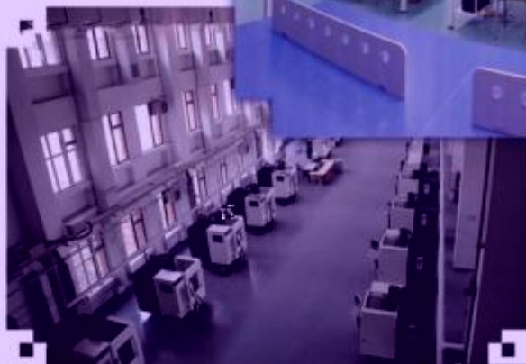
DMG 数控技术 训练场所