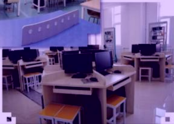
一体化课程教学设计 综合实训室